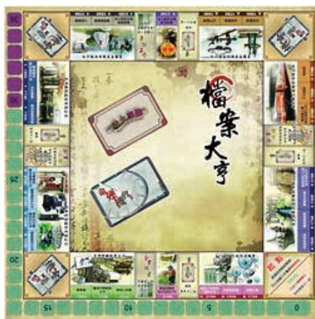
圖 1. 國家檔案桌上遊戲「檔案大亨」

檔案管理業務的改進往往是需要長期默默耕耘，辛勤努力的檔管人員都有滿腹不足為外人道的辛酸淚，但其績效成果卻是乏人問問；檔案加值應用則不然，績效成果都是公開的，因此特別能吸引輿論的關注與媒體的報導，更能藉以進行業務宣導，是機關自我行銷的絕佳機會。以法務部在 99 年與檔案局合辦的「歷史印記——百件珍貴獄政檔案展覽」為例，當時 1 件 37 年執行金壁輝（川島芳子漢名）死刑疑義檔案的面世，造成媒體爭相報導川島芳子的一陣熱潮（如圖 2），同時