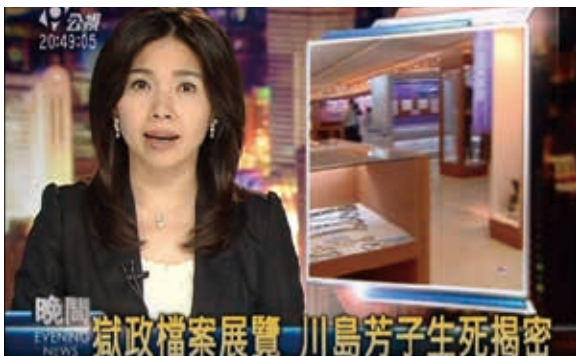
圖 2. 媒體報導「歷史印記—百件珍貴獄政檔案展覽」有關川島芳子檔案

優秀的檔管人員是檔案事業的重要資產，在辦理檔案應用業務的過程中，他們延伸了自我視野，甚至改寫機關的歷史，不僅發揮了檔案的價值，也