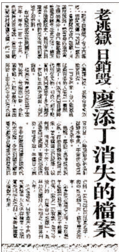
圖 3. 報載臺中監獄檔管人員查證廖添丁檔案資料

充分表露出檔管人員的價值。臺中監獄前檔管人員鄭滄淵於 3 年任職期間，為查證義賊廖添丁曾被關在臺中監獄且數度逃獄成功的民間傳說，積極蒐集臺灣總督府檔案，雖然未找到任何佐證文物，卻也從中查出了日本統治時期歷任典獄長姓名及機關名稱之沿革，並勘誤修正監史資料(如圖 3)；新竹監獄前檔管人員吳毓芝也化身文史工作者，從一篇關於新竹少年監獄暴動的剪報發端，考證出新竹監獄肇建始於清雍正 10 年(1732 年)，是北臺灣最早的監獄，比原先認知的資料上溯 165 年之久，並將重要沿革紀事補實，完整機關歷史(詳細內容參閱《檔案季刊》第 14 卷第 4 期「法務部矯正署新竹監獄辦理蒐集與展覽心得及經驗分享」。當然，兩位的表現也讓自己榮登金檔、金質雙料得主，以及隨之而來的職務晉升。