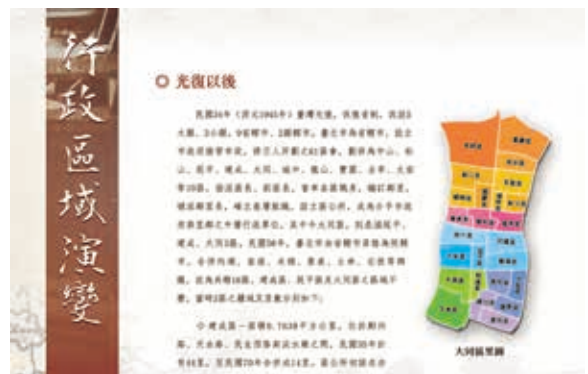
圖 5. 「從小大同到大大同」檔案展內容