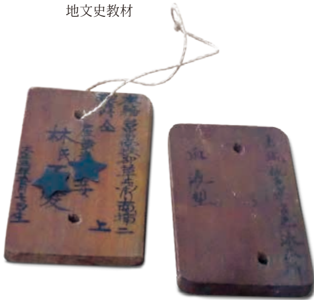
圖 4. 日本統治時期（民國前 6 年）身分證

資料來源：南投縣草屯鎮戶政事務所全球資訊網。檢自 http://cthr.nantou.gov.tw/introduce/leading.asp?id={52832307-A92E-4706-9E5B-7F907236FF52}